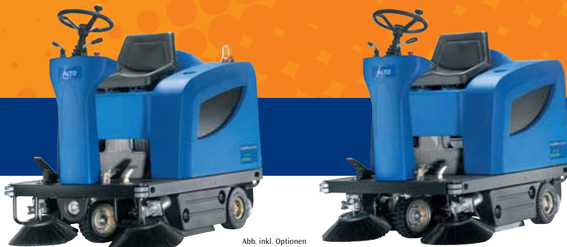
Abb. inkl. Optionen

Die FLOORTEC R570 Serie beinhaltet eine Batterie- und eine Benzinvariante, mit einer Kehrwalzenbreite von 700 mm. Darüber hinaus bieten wir eine breite Palette von Zubehör, mit dem Sie Ihre Kehrmaschine Ihren speziellen Bedürfnissen anpassen können.